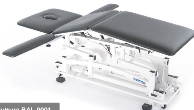
Colore struttura RAL 9001

Il lettino NIKE è un lettino di tipo professionale utilizzato da operatori qualificati del settore della riabilitazione e del massaggio per visite e trattamenti di Rieducazione Posturale.