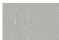
Grigio chiaro G2