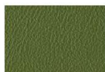
Verde bosco V2