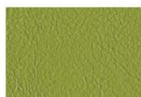
Verde foglia V3