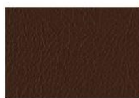
Marrone scuro M1