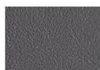
Grigio scuro G3