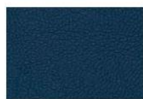
Blu scuro B3