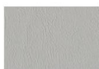
Grigio chiaro G2