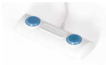
Giove 4 PLUS avec pédale de commande 24 V