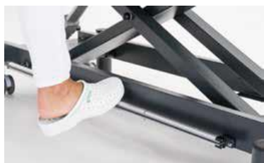
Giove 4 PLUS avec cadre de commande