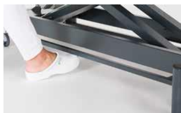
Giove 4 PLUS avec cadre de commande périphérique