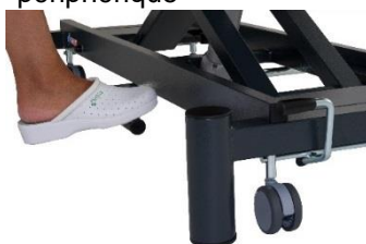
Giove 4 PLUS hydraulique