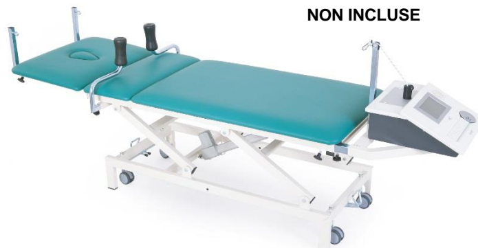
Table ADONE à trois plans réglable électriquement en hauteur pour examen et thérapie de traction utilisée par professionnels du secteur de la rééducation et du massage. La table est livrée avec tout ce qui est nécessaire pour les tractions lombaires et cervicales et avec un châssis supplémentaire et amovible de soutien à l'unité de traction et roulettes escamotables.